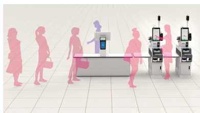
店員が商品登録し、買物客が精算を行う セミセルフレジ「スピードセルフ」イメージ図