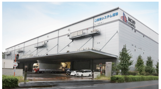
最寄り駅から徒歩約10分という好立地で、人員の確保がしやすいロケーション