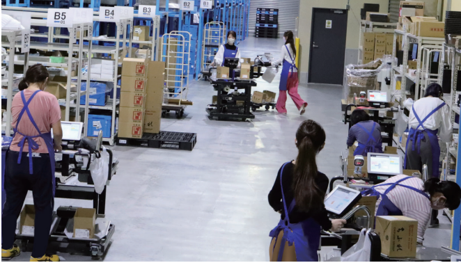
写真上:それぞれの注文にぴったりな箱に直接、ピッキングした商品を投入。 写真下:鶴ヶ島物流センターには、50台の「AIピッキングカート」が導入され、ピーク時にはフル稼働する