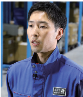
鶴ヶ島物流センター 所長代理