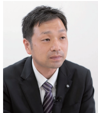
DC第3事業部 鶴ヶ島物流センター・川越第2センター 所長

事前に「SPK」で商品の長さ・幅・高さを計測して、商品を撮影した“商品マスター”を作成しているため、「AIピッキングカート」でのピッキング時には、商品マスターと照合し、そのまま検品レスで商品を出荷することができるのです。