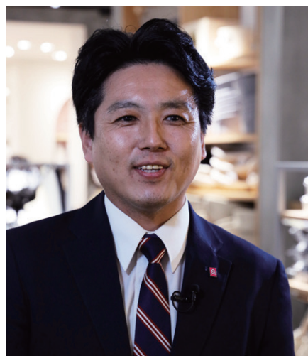
株式会社大創産業 総務部 広報課 課長