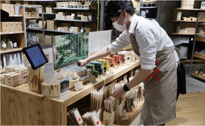
スタッフが売場に集中できるようになり、より買い物しやすいお店づくりが実現