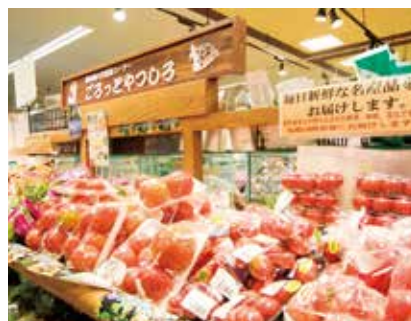
▲地元福岡をはじめ、九州各地のみずみずしい厳選野菜をラインナップ