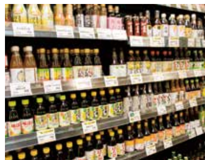
▲お醤油やポン酢、スパイスなど他にはない珍しい“ご当地調味料”も揃う