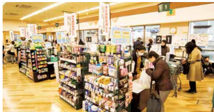
▲スムーズに進み、レジ待ち行列は解消