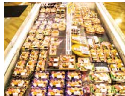
▲お弁当やお寿司、惣菜なども「おいしい!」と評判