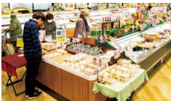
▲今後は単身者向けなどいろいろなニーズに合わせた惣菜を開発予定です