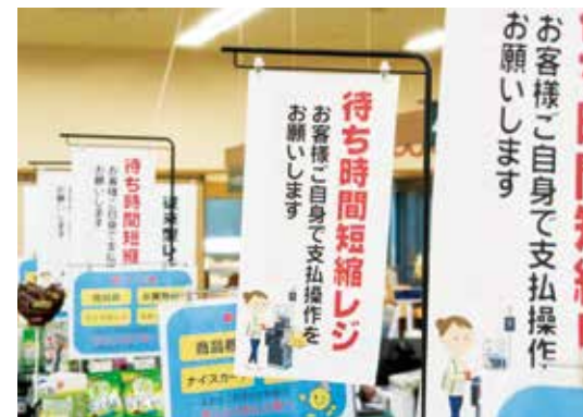
▲のぼりでお客様にお知らせ