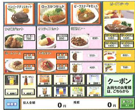
(※)登録可能メニュー数は900アイテム